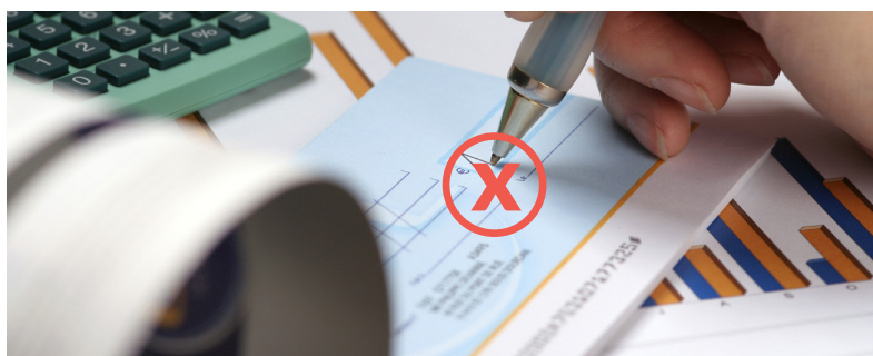
Attention, les chèques ne sont plus acceptés. Optez pour le prélèvement SEPA !

Depuis la période déclarative de novembre 2020 (exigible au 15 janvier 2021) ou encore du 4 ème trimestre 2020 (exigible le 15 février 2021), le paiement des cotisations au format dématérialisé est obligatoire.